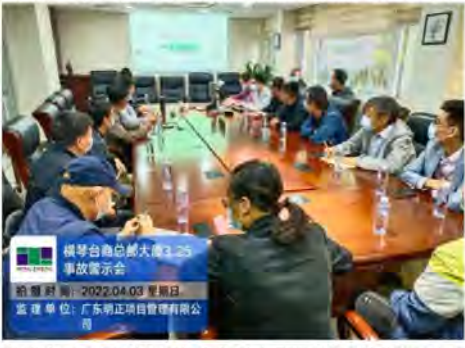
横琴台商总部大厦3.25事故警示会

四是督促项目塔吊司机、司索指挥人员进行起重吊装知识突击培训, 强化关键岗位培训与教育, 加强起重吊装作业现场管理。吊装作业前, 必须对作业人员的安全技术交底, 必须对防护措施落实情况进行确认, 必须对起重吊具进行检查确认, 确保处于完好状态。吊装作业过程中, 作业人员必须严格遵守起重机械安全操作规程和标准规范, 严格遵守“十不吊”的各项规定, 相关人员要落实旁站监督职责, 及时制止违章指挥、违章作业和违反操作规程等行为。